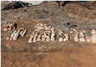
발굴현장 출토유물 분류