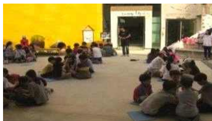
[교육연계 흥놀이 프로그램]