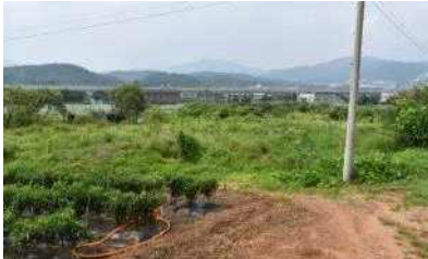
8차 정밀시굴조사 현장