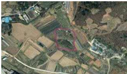
8차 정밀시굴조사 위성사진