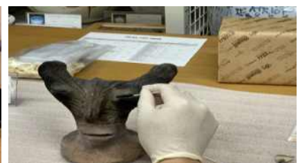
[수장고 및 소장품관리]