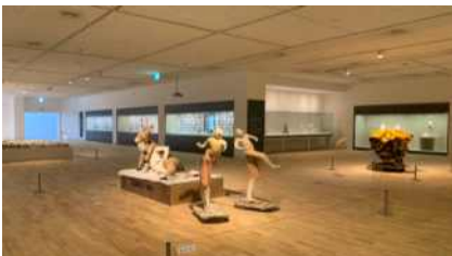
[전시: 생각하는 손]