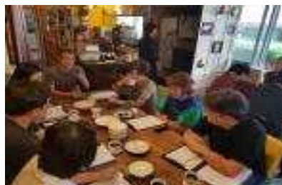
[자문위원단 공개 컨설팅]