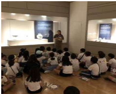
[가족프로그램 우리집 식탁]