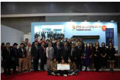
[개막식 & 공모전 시상식]