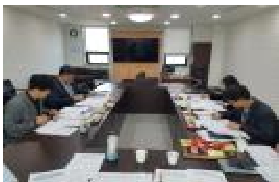
[전시 단체 선정 심사]