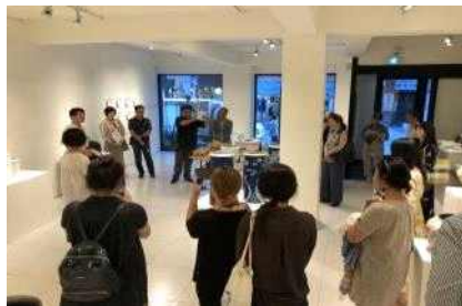
[전통공예원 입주작가 기획전]