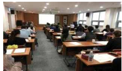
[도자로 보는 인문학 강좌]