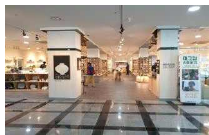
[이천 도선당 이전]