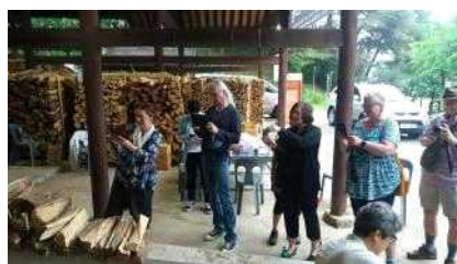
[전통가마 소성 관람객]