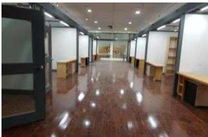
[창조공방(이천) 이전 조성]