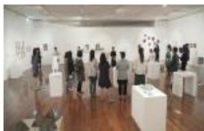
[흙의 시나위 30주년 기념전]