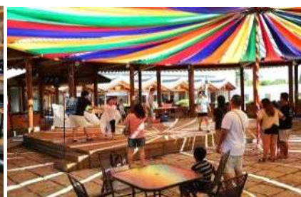
[도자기축제 연계 판매 이벤트]