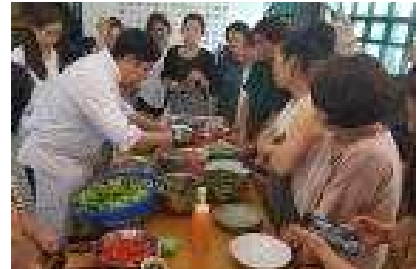
[도예인 전문 교육]

작성자 : 도자지원센 팀장 : 정연중 ☎ 031-645-0650 담당자 : 임인영 ☎ 031-645-0651