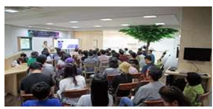
[상반기 작가와의 만남]