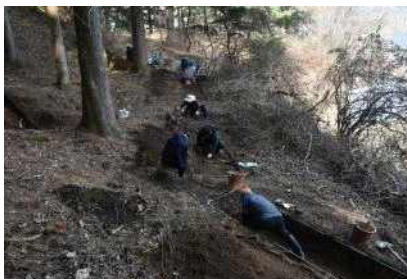
도자문화재 시굴조사 모습