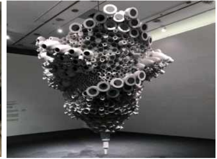
[2017 대상 수상작가 전시작품]