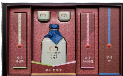
청와대 설 선물 세트