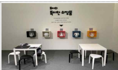
스마트 뮤지엄 콘텐츠 운영