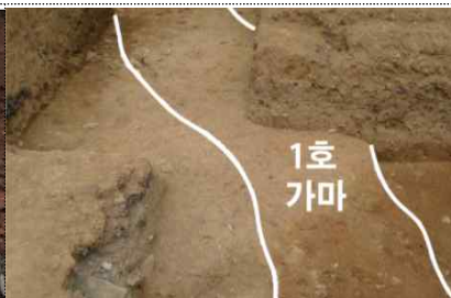
종합정비 자료정리(송정동 가마)