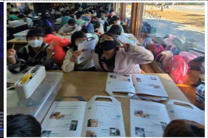
교육프로그램 「박물관 탐험대」