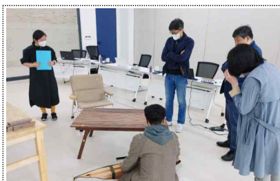
공예 창업·창작 프로그램 운영