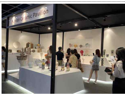
해외 우수박람회 참가