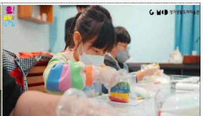
미술관 연계 교육프로그램 운영