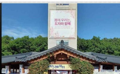
도자세상 판촉 이벤트