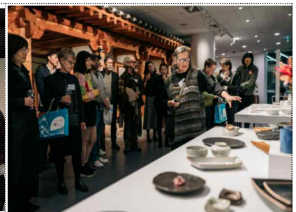
문화원 연계 전시