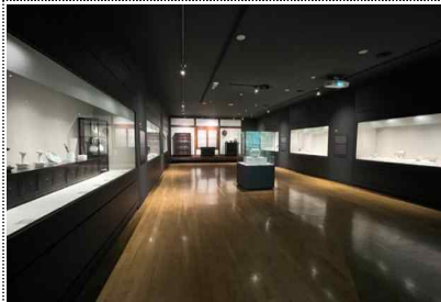
경기도자박물관 개편 상설전