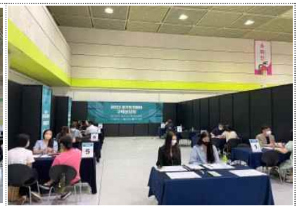
유통바이어 초청 구매상담회