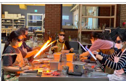
공예교육 프로그램 운영