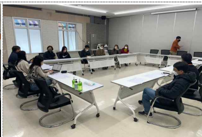
재단 탐별 대면회의('22.11.1.)