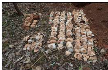
시·발굴 조사를 통한 출토 유물