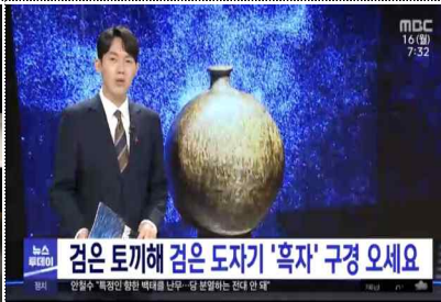
기획전 MBC 보도영상